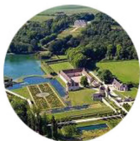
Implantée dans le Domaine de Villarceaux en 2002