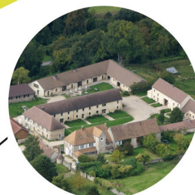
La Bergerie de Villarceaux lieu d'accueil de groupes ouvert depuis 2012

La Source-Villarceaux est équipée de deux grands ateliers, d'une résidence d'artiste (studio et atelier), d'un lieu d'exposition, d'une cuisine collective équipée et d'une salle à manger.